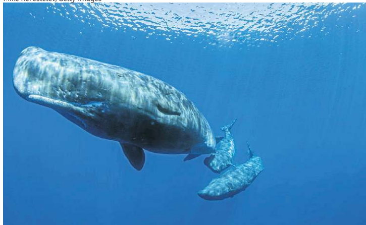
Cachalotes mostram ter até uma espécie de alfabeto