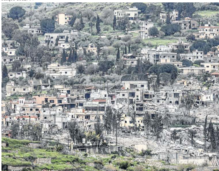
A destruição no sul do Líbano, vista da fronteira israelense

como uma "zona de segurança" para impedir que o Hezbollah possa seguir disparando foguetes e lançando drones contra povoações do extremo norte israelense.