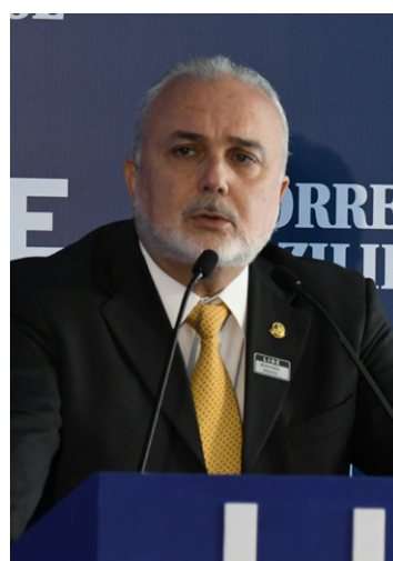
Jean Paul Prates: guerra no Irã tem efeitos positivos e negativos