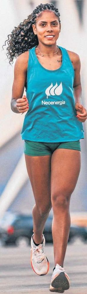
A atleta pernambucana de 24 anos é natural da reserva de Xukuru, no distrito de Cimbres (PE)