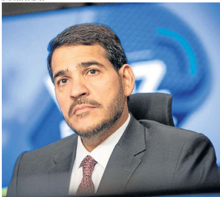
Parecer é mais um passo para a tramitação da indicação de Messias