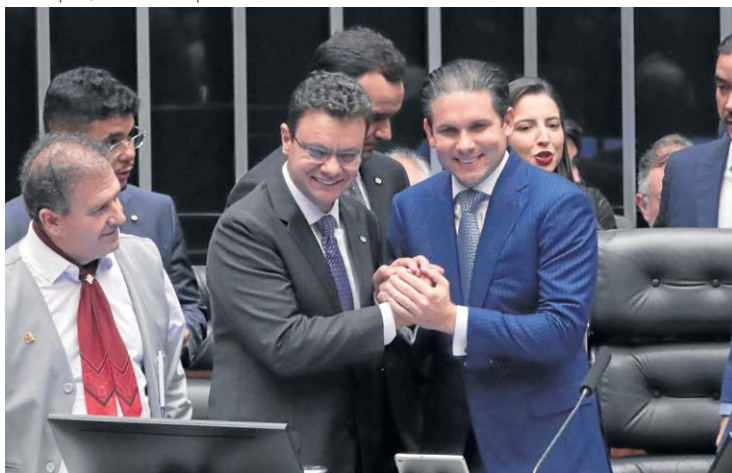
Cunha (E) é cumprimentado por Motta: agora votação será no Senado

como sinal de coesão da Câmara e fez referência direta ao movimento contrário à sua candidatura. “A votação desta noite é um exemplo para a democracia brasileira”, afirmou, ao agradecer pelos apoios recebidos. “Compreendo a missão e a responsabilidade que tenho neste momento. Essa votação representa o compromisso de mantermos essa Casa unida em