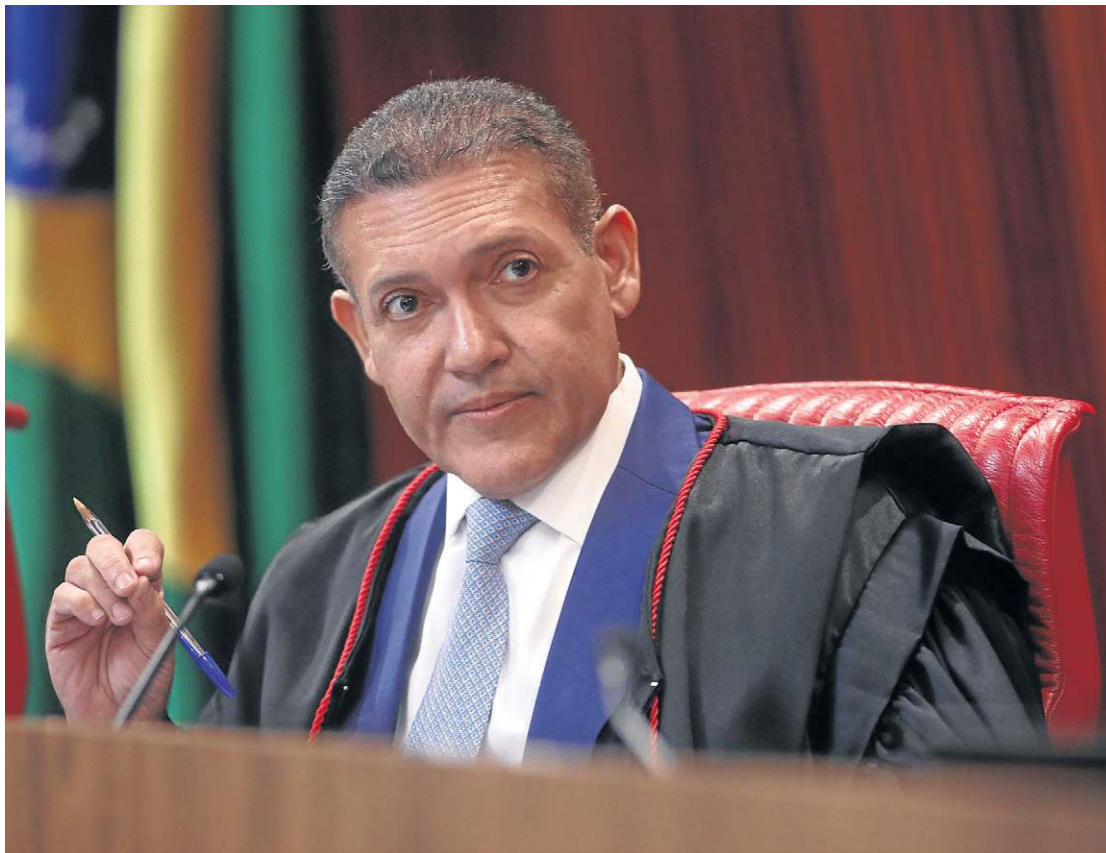
Indicado por Bolsonaro ao Supremo, Kassio Nunes Marques vai presidir o TSE pelos próximos dois anos

TSE sob a justificativa de que, se esperasse até 3 de julho, restaria pouco mais de 100 dias para as eleições, o que poderia comprometer a tranquilidade administrativa.