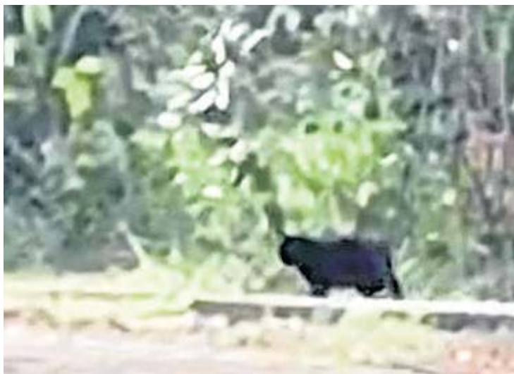
Felino circulava perto das pistas, e moradores chamaram a polícia

ambientais, redução de habitat e o comportamento natural de deslocamento de diversas espécies podem fazer com que animais silvestres sejam avistados em áreas urbanas.