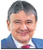
» WELLINGTON DIAS Ministro da Assistência e Desenvolvimento Social, Família e Combate à Fome

processo contínuo de qualificação dos dados que compõem o cadastro. O trabalho é coordenado no âmbito do Sistema Único de Assistência Social (Suas). Cada ente tem papel definido: municípios coletam informações, estados apoiam a gestão local, e a União coordena, normatiza, supervisiona e ajuda a financiar. Esse modelo descentralizado garante a qualidade e maior precisão dos dados.