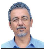
» MAURÍCIO ANTÔNIO LOPES Pesquisador e ex-presidente da Embrapa

tropical e os ganhos contínuos de produtividade demonstraram que o conhecimento científico pode transformar radicalmente a capacidade de produção de alimentos. Em muitas regiões do mundo, esses avanços contribuíram para reduzir a fome e ampliar a oferta de alimentos.