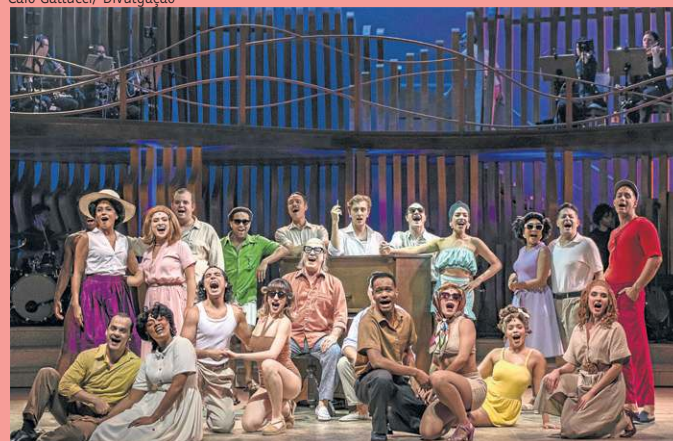
Elenco de Tom Jobim Musical