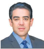
» BRUNO DANTAS Ministro do Tribunal de Contas da União (TCU)

como dogma intocável: o texto originalmente assinado torna-se sagrado, qualquer modernização, infidelidade. O administrador, impedido de adaptar, refugia-se na omissão. E a sociedade, que depende desses serviços, paga o preço da paralisia.