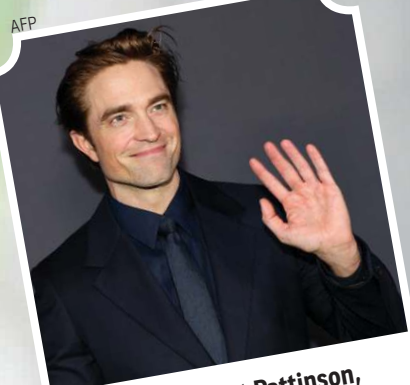
O ator Robert Pattinson, em evento recente

ASTROS DA SÉRIE, QUE VOLTOU AOS CINEMAS, APÓS 18 ANOS ESTÃO EM ALTA: ROBERT PATTINSON TERÁ TRÊS FILMES DE ENORME APELO, EM 2026, ENQUANTO KRISTEN STEWART, DEPOIS DA ESTREIA COMO DIRETORA, VIVERÁ CASAL COM WAGNER MOURA