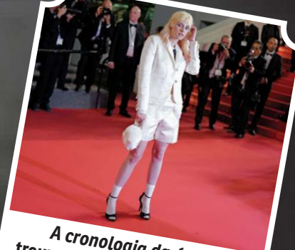
A cronologia da água trouxe a diretora Stewart, para a 78ª edição do Festival de Cannes, em 2025