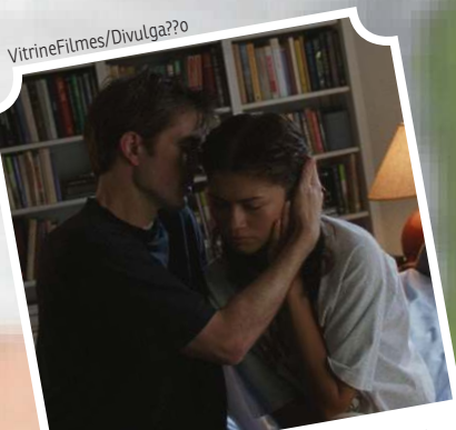
Em O drama , Pattinson interpreta Charlie, um incrível noivo, diante de suas escolhas