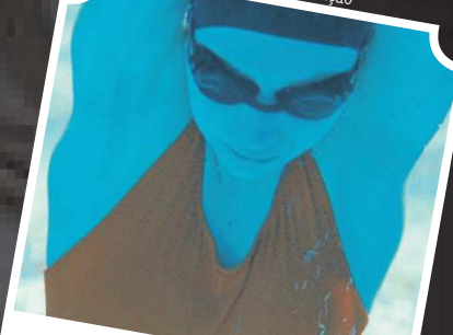
A cronologia da água: direção criativa a cargo de Kristen Stewart