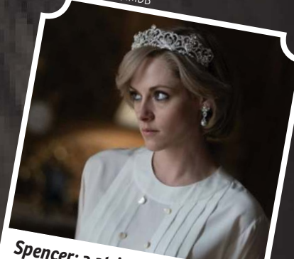
Spencer: a atriz Kristen Stewart é a protagonista do longa de Pablo Larraín