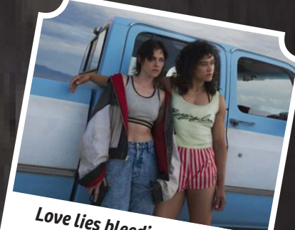
Love Lies bleeding: O amor sangra traz uma jornada acidentada para as protagonistas