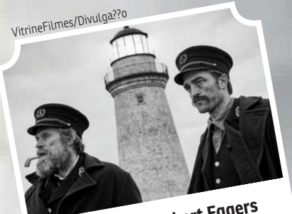
O farol teve Robert Eggers na direção e Willem Dafoe no elenco