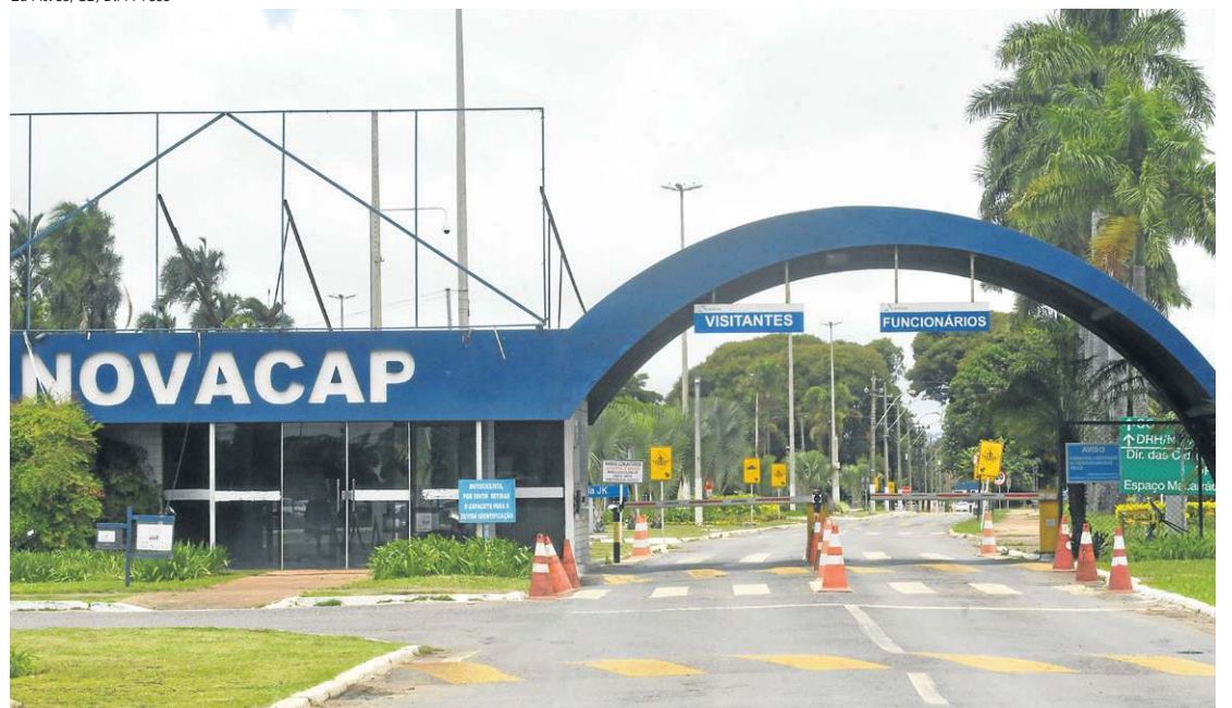
Sede da Novacap é um dos nove imóveis colocados como garantia à capitalização do banco estatal