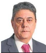
» WADIH DAMOUS Diretor-presidente da Agência Nacional de Saúde Suplementar (ANS)

Isso exige mudança de cultura institucional. Devemos transitar do modelo de pagamento por volume, que, muitas vezes, incentiva o excesso de exames desnecessários, para a lógica de geração de valor em saúde. Quando antecipamos riscos por meio do uso inteligente de dados, da interoperabilidade e do monitoramento contínuo, preservamos a saúde financeira das operadoras e garantimos dignidade e qualidade aos beneficiários que confiam no sistema.