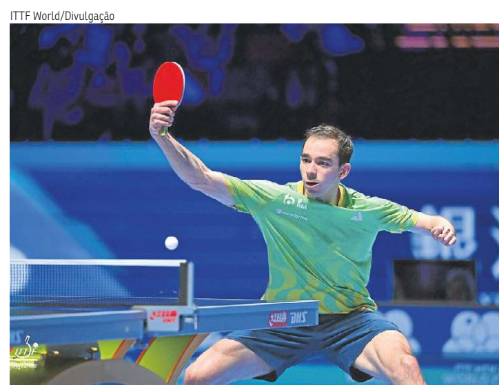
Na temporada 2026, Hugo Calderano ostenta 18 vitórias em 23 jogos

Hugo Calderano perdeu para o chinês Wang Chuqin, líder do ranking, por 4 sets a 1 (parciais de 11/7, 11/3, 11/7, 6/11 e 12/10), na semifinal da Copa do Mundo em Macau, mas ficou com a medalha de bronze. Chuqin foi campeão do torneio. O brasileiro de 29 anos foi campeão da Copa do Mundo de tênis de mesa no ano passado, o primeiro atleta das Américas, e buscava o bicampeonato. Entretanto, teve de se contentar com o terceiro lugar, ao lado de Lin Yun-Ju, de Taiwan, derrotado pelo japonês Sora Matsushima. Na caminhada até o bronze, Calderano bateu o tcheco Lubomir Jancarik e o sueco Kristian Karlsson na fase de grupos. Nas oitavas, despachou o japonês Shunsuke Togami. Nas quartas, mandou o francês Alexis Lebrun para casa, antes de cair diante de Wang Chuqin. O confronto de ontem foi o sétimo entre Chuqin e Calderano, com ampla vantagem para o chinês, vitorioso em cinco duelos.