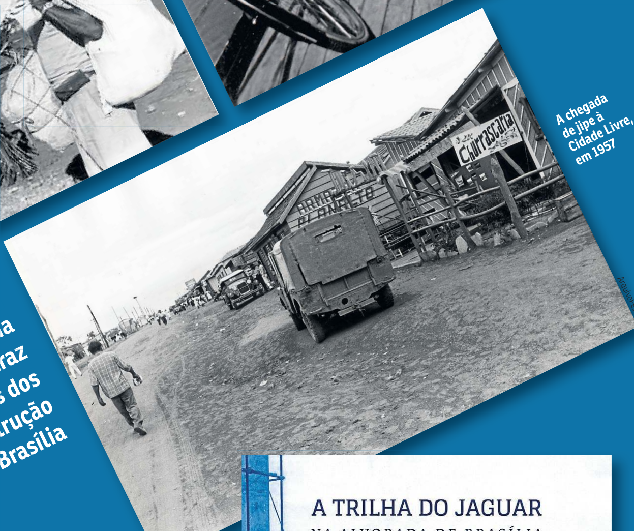
Foto de Ake Borglund sobre Brasília compõe o acervo de Mercedes Urquiza

A chegada de jipe à Cidade Livre, em 1957