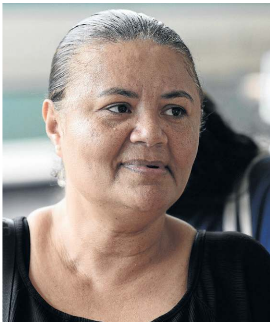
Ediniuza resolve as demandas em Brasília