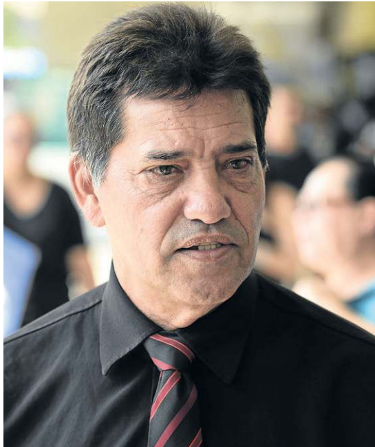
Francisco não pretende mudar o endereço eleitoral