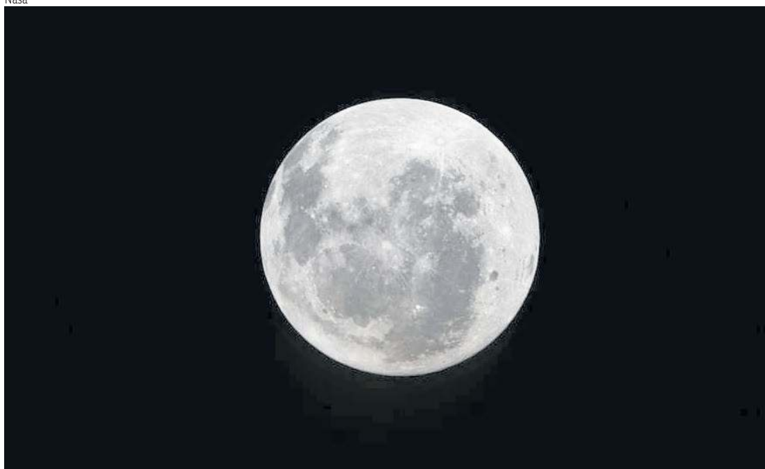
Com a Artemis II, pela primeira vez humanos observam por completo a Bacia Oriental, a olho nu

Missão, em Houston. Ele destacou, ainda, o contato com os entes queridos. “Estamos aqui em cima, tão longe, e por um momento voltei a me reunir com minha pequena família. Foi simplesmente o maior momento de toda a minha vida.”