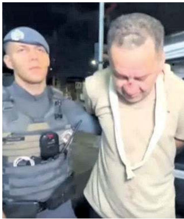
Demóstenes disse em depoimento que o acelerador do carro travou