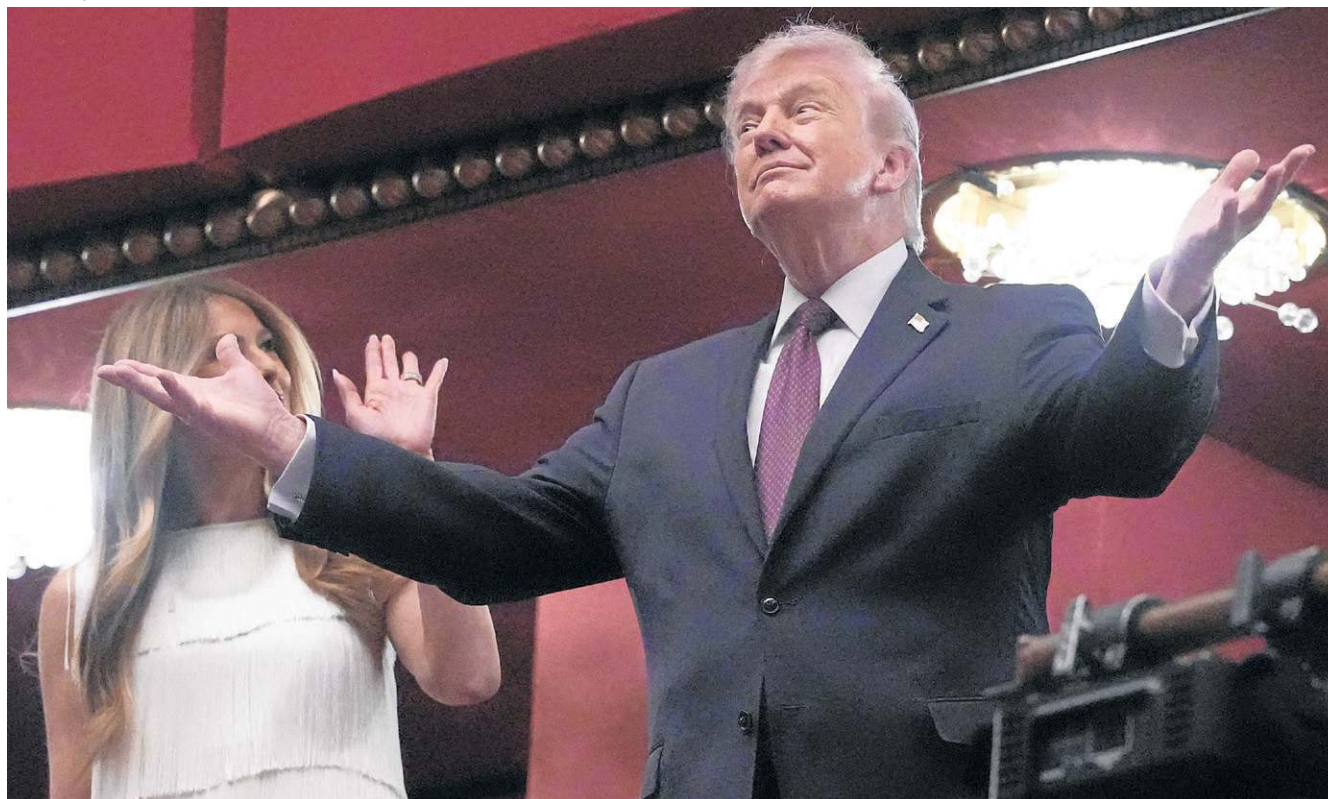
Donald Trump e primeira-dama, Melania, durante peça de teatro no Kennedy Center, em Washington: republicano em apuros

presidente esperava. O regime iraniano não entrou em colapso, e sua habilidade de fechar o Estreito de Ormuz tem colocado a economia mundial em risco”, disse. O estudioso admitiu que os riscos políticos causados pela guerra para Trump são “muito graves”. “Ele será responsabilizado pelo aumento nos preços da gasolina e dos alimentos, e por uma possível recessão econômica. A culpa é inteiramente dele: não há como culpar ninguém mais”, ressaltou Walt.