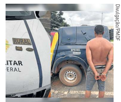
Suspeito voltou ao local com mais uma arma para fazer ameaças

Ele acabou contido por moradores da região até a chegada das viaturas do rádio patrulhamento rural. Durante a abordagem e identificação, os policiais militares constataram que o detido já é um velho conhecido da justiça. O histórico