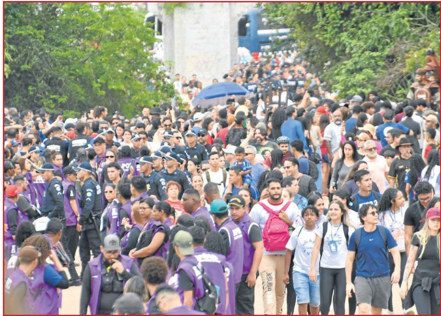
Milhares de católicos acompanharam a via-sacra em Planaltina