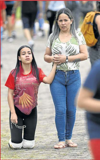
Dia de agradecer bênçãos recebidas