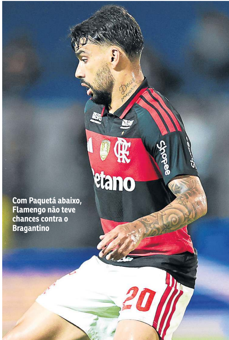
Com Paquetá abaixo, Flamengo não teve chances contra o Bragantino

primeiros tempo, mas, ainda assim, demorou para encontrar a rede em Barueri. O gol saiu apenas aos 43, com Marlon Freitas. Titulares, os convocados Arias e Flaco López foram bastante participativos. Os gaúchos ressurgiram na etapa final e empataram com o artilheiro Carlos Vinícius. Marlon Freitas, no entanto, apareceu novamente para garantir os três pontos.