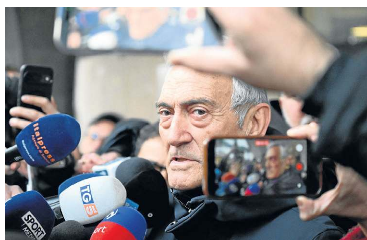
Sob a gestão de Gabriele Gravina, Azzurra ficou fora de três Copas

Perguntado sobre a ausência da Azzurra na Copa do Mundo pela terceira edição consecutiva, Ceferin afirmou que “a Itália é um dos países mais importantes do futebol e voltará ao topo”.