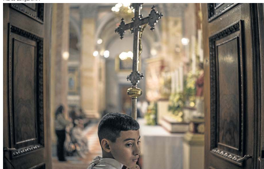
A Igreja do Cristo Salvador, em Jerusalém: Semana Santa sem fiéis nas missas

antiaéreos a primeira noite da Páscoa judaica — um jantar tradicional conhecido como Seder. O Pessach marca a fuga dos judeus do Egito, sob a liderança de Moisés, com destino à Terra Prometida, episódio narrado no Antigo Testamento no livro do Êxodo . "Não era minha primeira opção", lamentou um escritor que se identificou apenas como Jeffrey, em um bunker em Tel Aviv. "Mas, aqui no abrigo, pelo menos podemos sentar e esperar que isso passe". O comando militar israelense anunciou a determinação de "punir severamente" o Hezbollah por ter intensificado os bombardeios desde