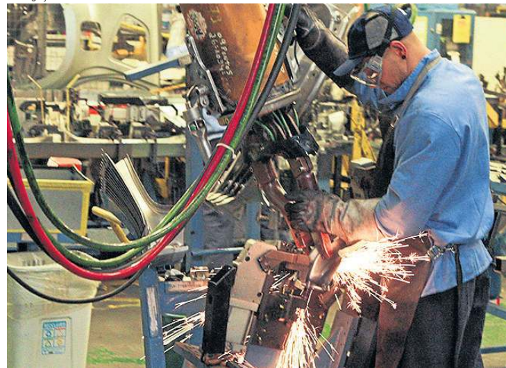
Veículos impulsionaram desempenho da indústria de transformação

uma aceleração significativa da inflação dos custos industriais”, avaliou a Fiesp.