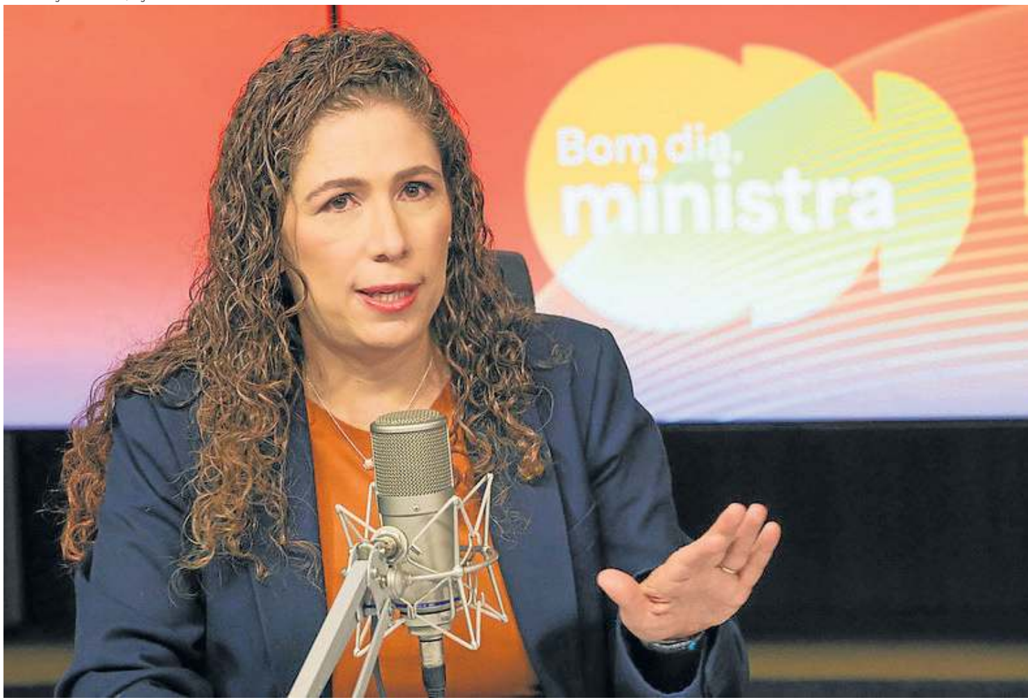
Segundo a ministra, os concursos homologados antes do período eleitoral poderão ter convocações normalmente, sem restrições legais