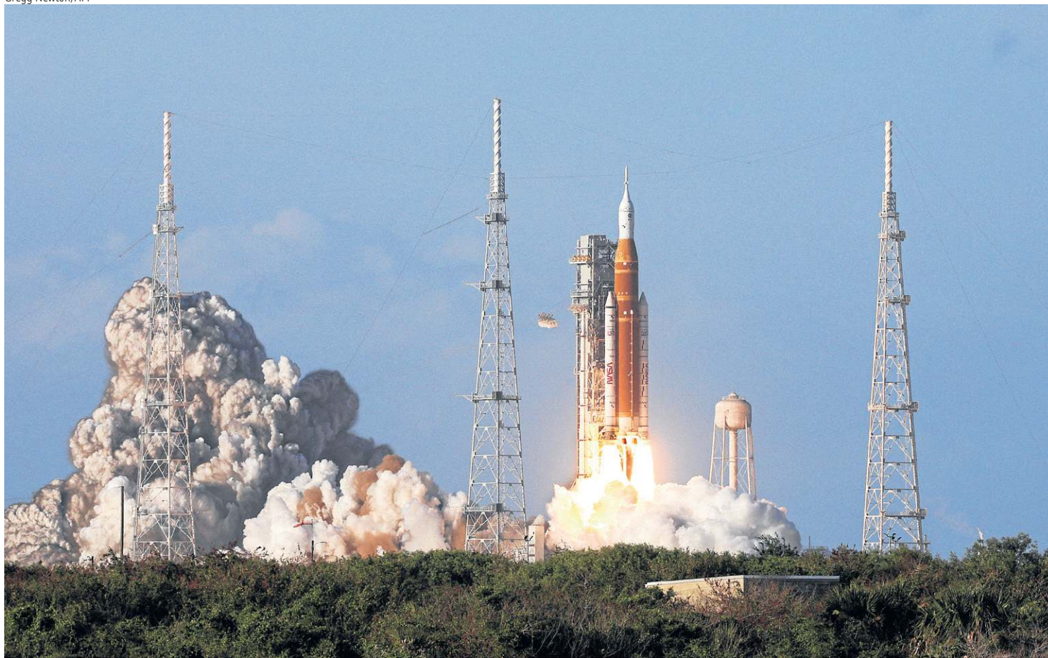
A Artemis II decolou às 18h35 (19h35, no horário de Brasília) para uma missão estimada em 10 dias: viagem abre nova fase da exploração espacial