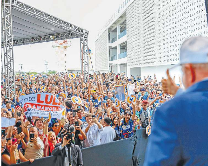
Lula participou de evento em Fortaleza: críticas a seu ex-ministro

Sabe aquela pessoa que acha que o partido não vale nada?”, acrescentou.