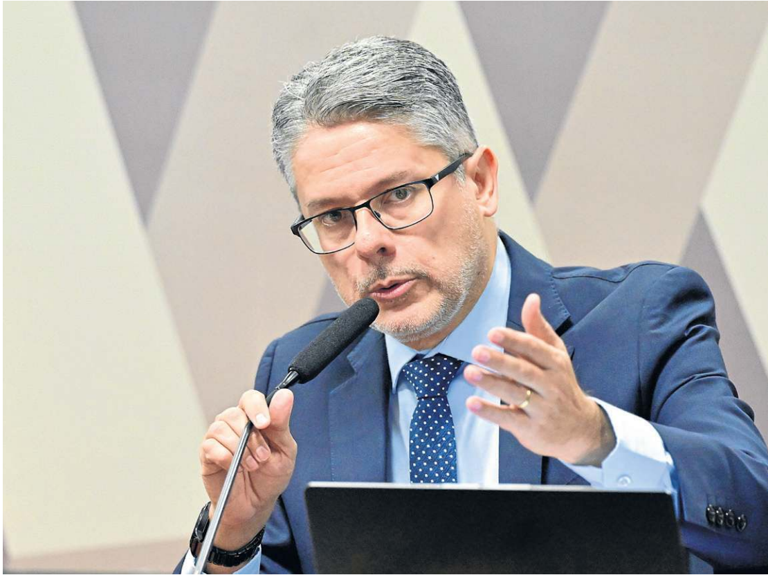
Senador afirma que a lei não deve distinguir e ser implacável, sobretudo, com os ministros do Supremo