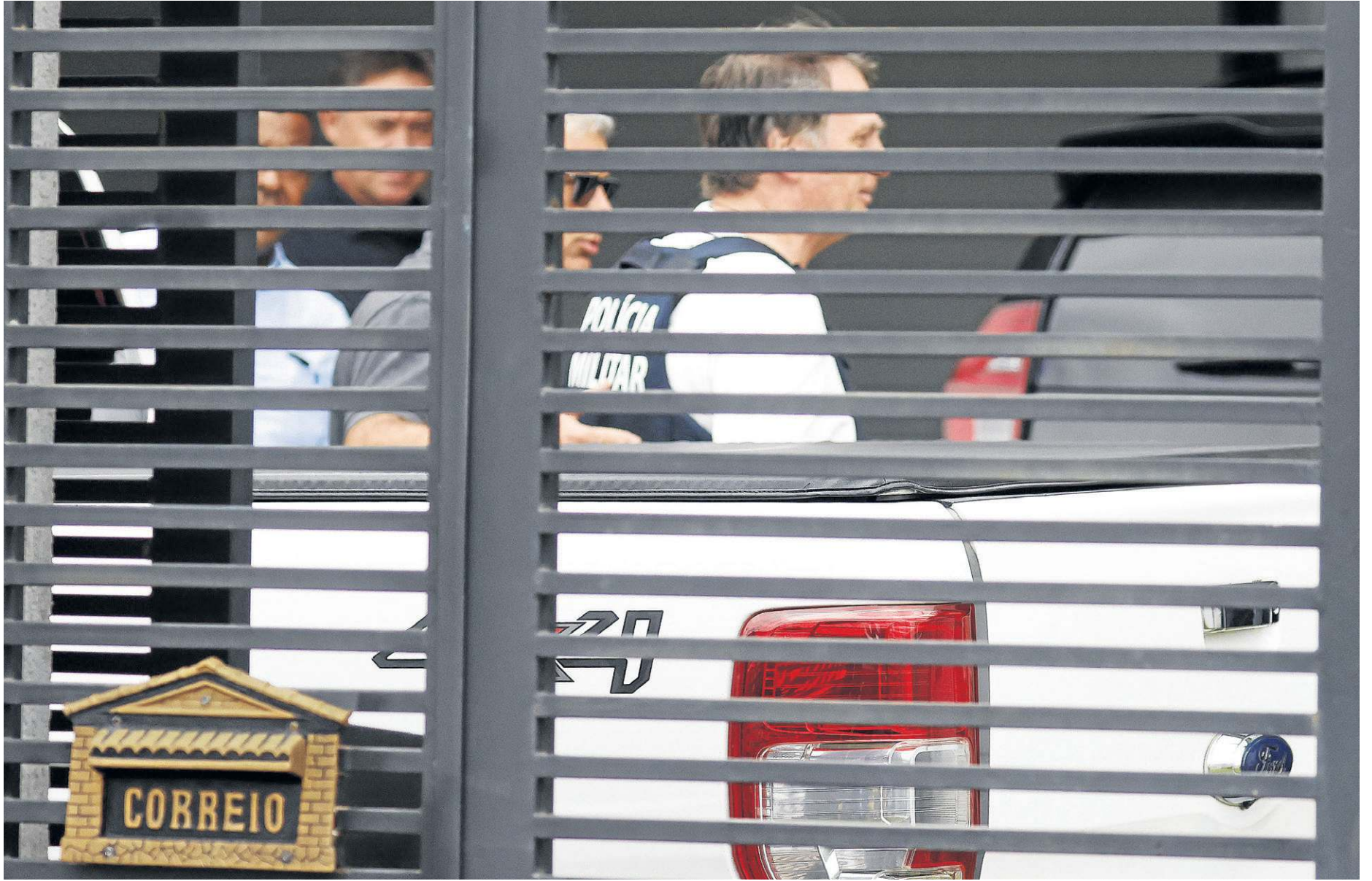
Bolsonaro ao voltar para casa, na sexta-feira. Poucos presos têm condições de cumprir pena junto da família