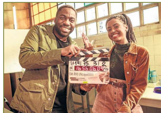
Dirigida pelo ídolo Lázaro Ramos no longa Um ano inesquecível — Outono