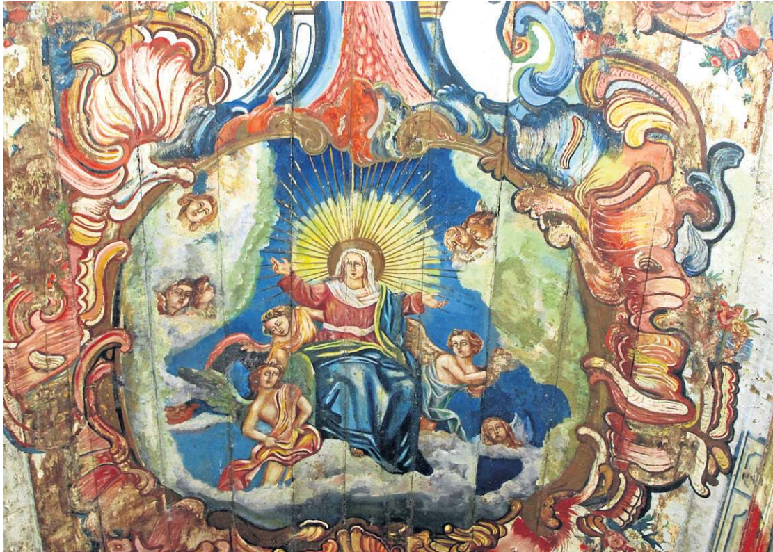
Capela Nossa Senhora do Pilar, em Sabará, na Região Metropolitana de Belo Horizonte