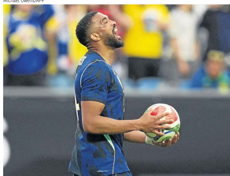
Jogador marcou o gol de honra da Seleção no amistoso de ontem