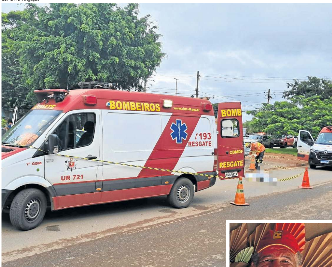
Bombeiros tentaram reanimar a vítima por 30 minutos

houve necessidade de encaminhamento hospitalar.