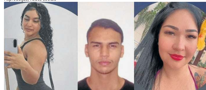
Os técnicos de enfermagem estão presos e viram réus