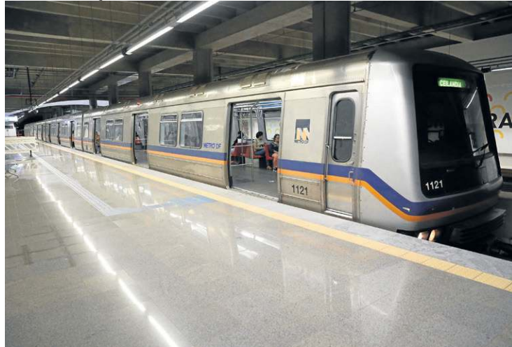
Categoria cobra concurso público e melhores condições de trabalho