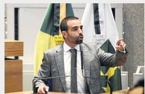
Minervino Júnior/CB/DA Press