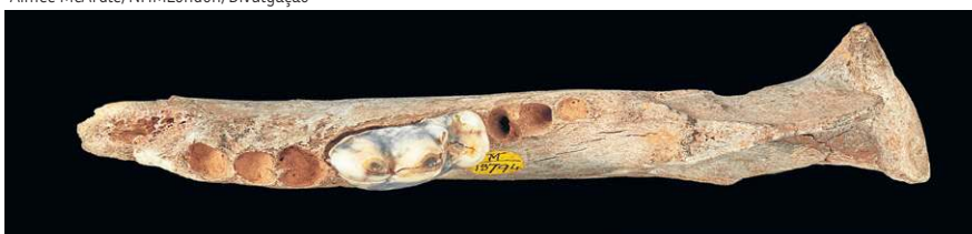
Mandíbula de cachorro de 14,3 mil anos, escavada na Caverna de Gough