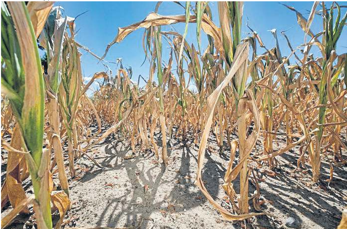
Secas extremas atingirão importantes regiões agrícolas mesmo com aumento de 2°C sobre níveis pré-industriais

Nessa área, os modelos climáticos têm diferenças muito grandes: a frequência de secas com um aquecimento de 2°C pode permanecer inalterada ou aumentar em mais de 50%. “Com 2°C, 10 dos 42 modelos examinados produzem um aumento de secas consideravelmente acima da média daqueles com um aquecimento de