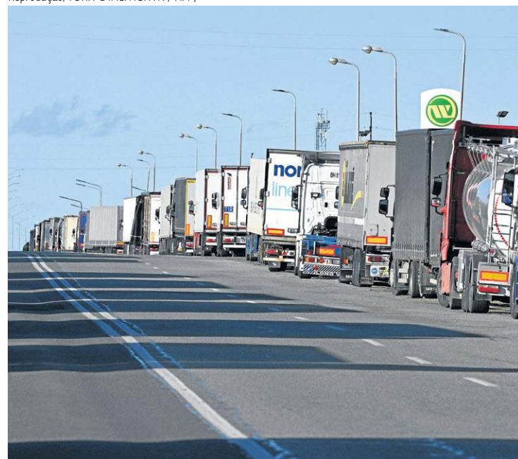
A categoria ameaçava com greve, caso reivindicações não fossem aceitas