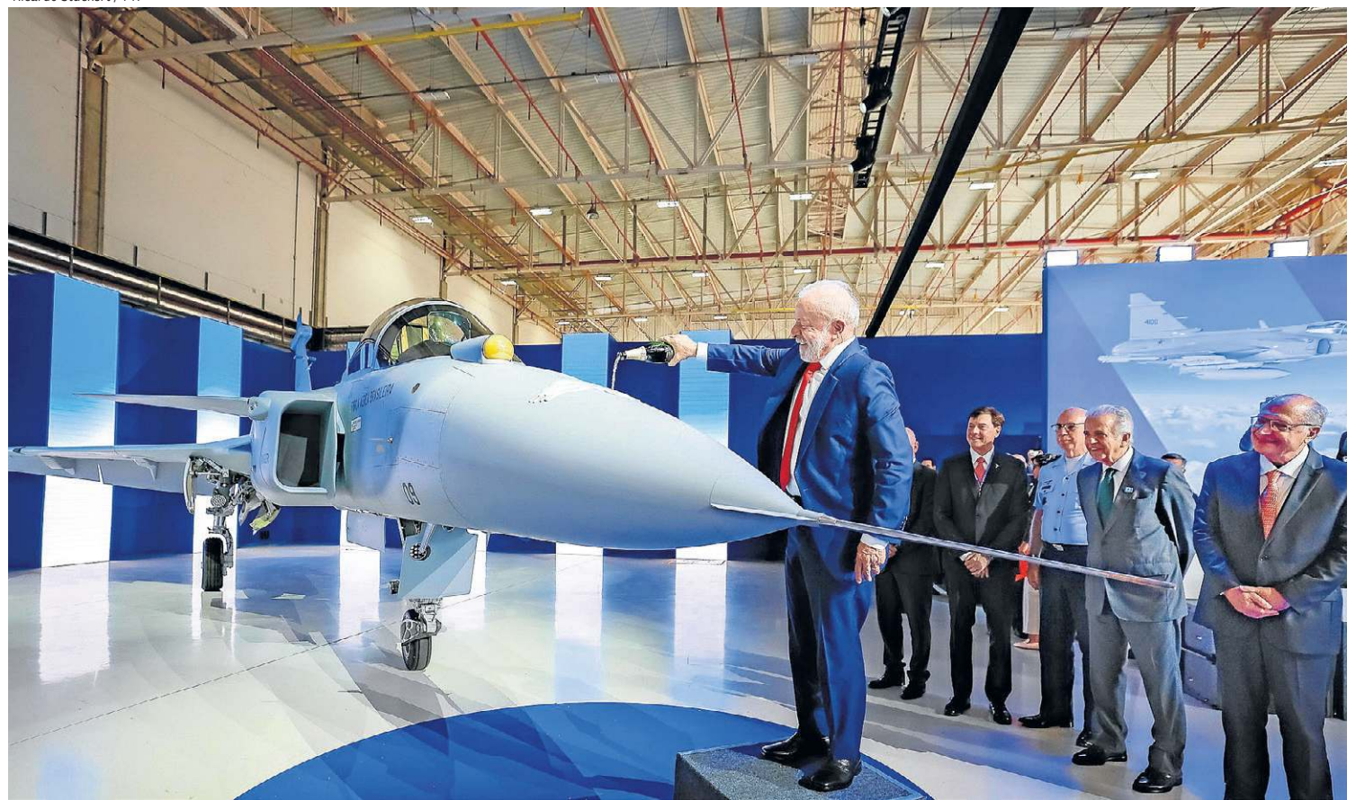
Fruto da parceria entre a Embraer e a sueca Saab, o Gripen foi exibido na Unidade Gavião Peixoto do Aeródromo Embraer, em São Paulo