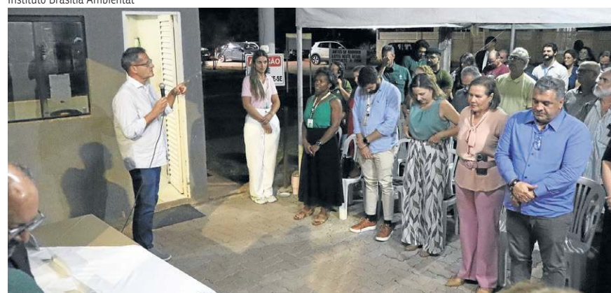
Instituto Brasília Ambiental

No discurso, Cappelli disse que, há um ano e meio, se reuniu com lideranças como Érika Kokay (PT) e Leila Barros (PDT) e defendeu a frente ampla. "Naquela época, eu disse que chapa de esquerda no Distrito Federal está errado, porque vai eleger a extrema direita. Nós temos que ter capacidade de unir a esquerda, mas ir além", salientou. "Tem gente que acha que não é possível ganhar a eleição no Distrito Federal e que é melhor marcar posição. Estou convencido de que se a gente montar uma frente ampla, com setores que não pensam como a gente, mas que fazem oposição ao Ibaneis, nós vamos ganhar", acrescentou.