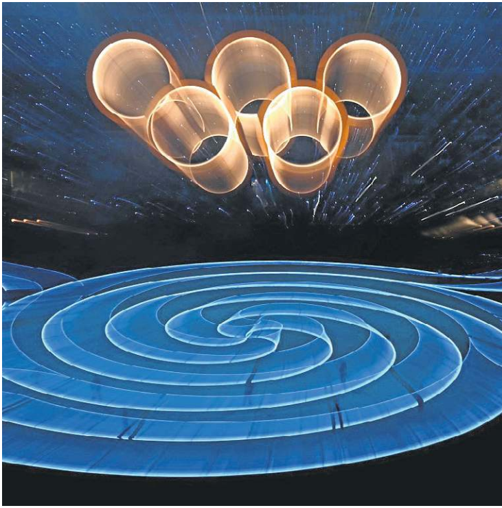
Celebração relembrou a história do evento e dos esportes na neve