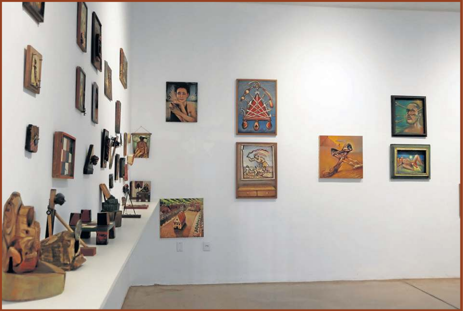
... o artista reaproveita materiais e coloca a sustentabilidade como um dos eixos...