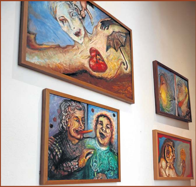
...centrais do trabalho de cerca de 300 peças