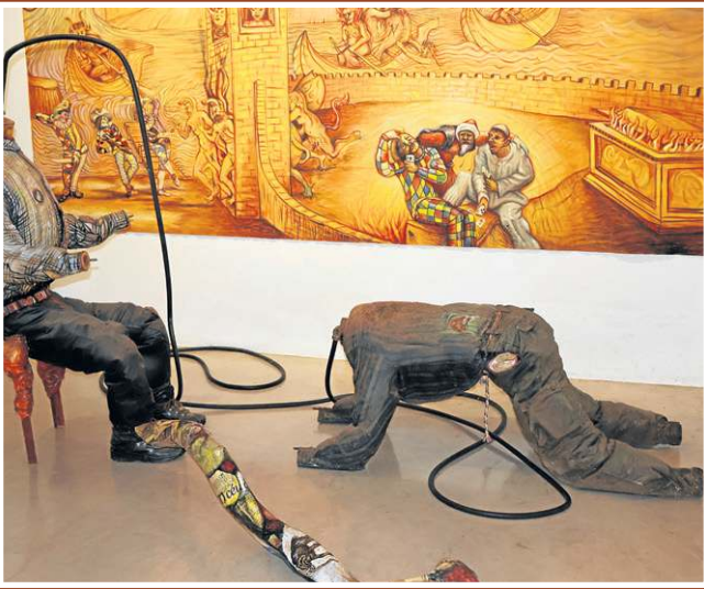
... enquanto a instalação simboliza o ambiente infernal