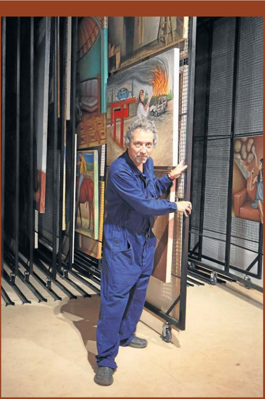
Obras de Nelson Maravalhas estão no museu