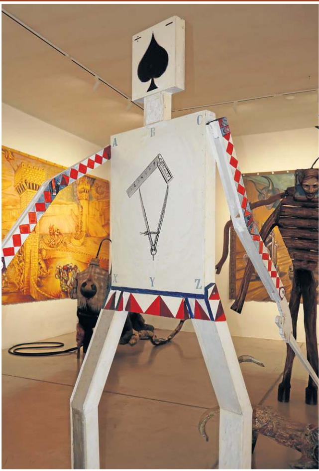
Personagem representa a racionalidade...