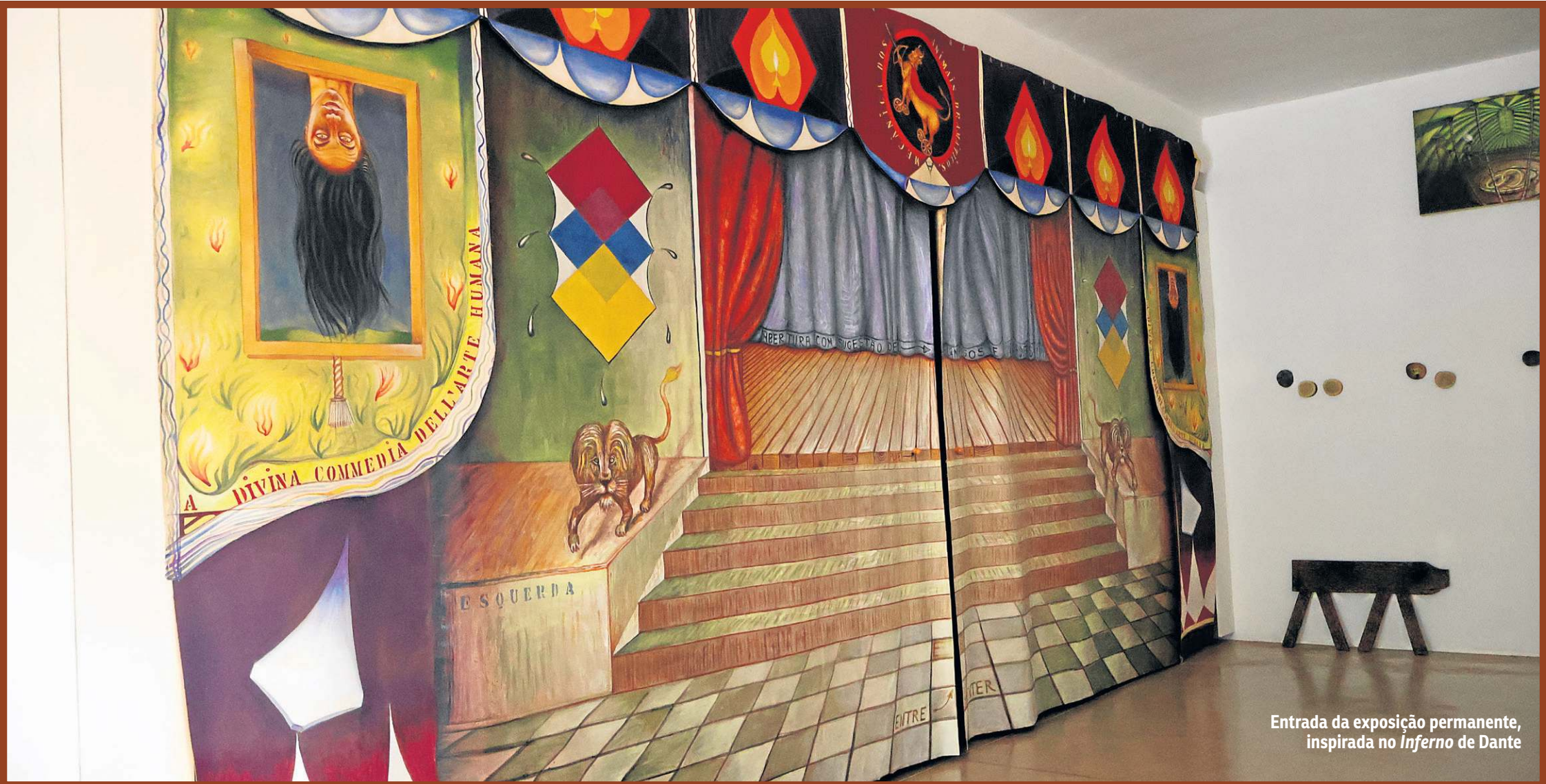
Entrada da exposição permanente, inspirada no Inferno de Dante