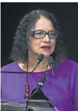
Luciana Santos, ministra da Ciência