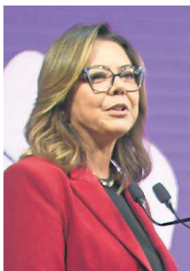
Leila do Vôlei, Senadora do PDT-DF