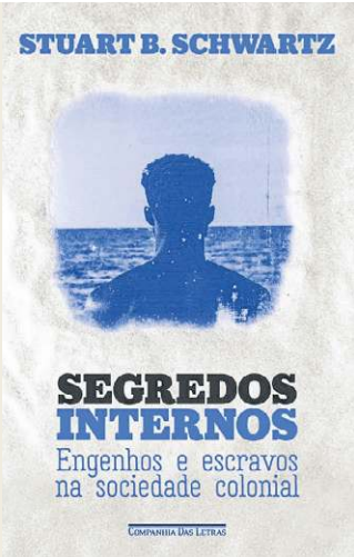
COMPANHIA DAS LETRAS