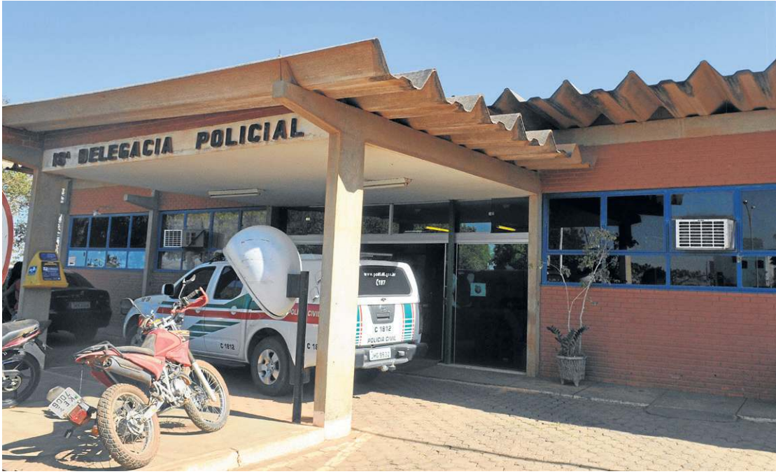
A direção da creche apresentou imagens de câmeras de segurança a autoridades policiais

possibilidade de correção pedagógica ou contenção, configurando claramente violência contra os alunos.