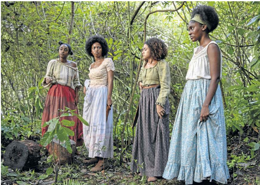
Quatro meninas: premiado no Festival de Brasília, seguirá para Berlim