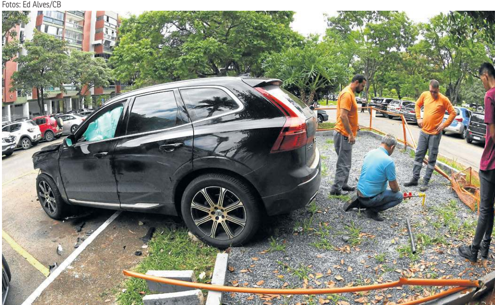
O carro também bateu em outros dois veículos estacionados

Segundo a síndica, o veículo, um Volvo preto, entrou na quadra, parou por alguns instantes e depois acelerou bruscamente em direção ao estacionamento, que fica em frente à central. O carro derrubou uma placa de sinalização, atingiu um veículo estacionado, que teria sofrido perda total, em seguida, subiu sobre a central de gás, rompendo a tubulação. Depois disso, ainda bateu em outros dois carros. O veículo parou somente quando atingiu a estação de gás.