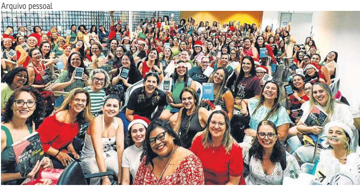
O último encontro do ano do Clube de Leitoras, em dezembro, reuniu centenas de mulheres na Biblioteca Nacional

Encerrando a exposição Territórios Criativos — Do Brasil para o Mundo, o Pátio Brasil recebeu, em 18 de dezembro, a Roda de Conversa e Apresentação do Brasília Hub Criativo, encontro que colocou em foco o presente e, principalmente, o futuro da economia criativa na capital federal. A iniciativa reforçou o protagonismo de Brasília como cidade criativa do design, título concedido pela Unesco em 2017, ao promover debates sobre inovação, oportunidades para artistas e empreendedores e a conexão entre tendências globais e identidades locais. Durante o evento, também ganharam destaque marcos recentes e futuros da agenda criativa da cidade, como a realização do IX E Criativo, Encontro da Rede Brasileira de Cidades Criativas da Unesco, e a expectativa para o II Fórum de Cidades Criativas do Design, previsto para março de 2025.