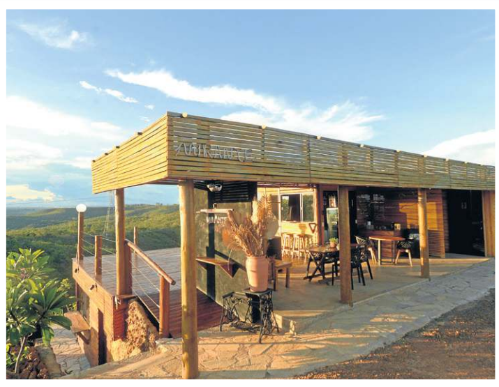
O Mirante da Cabana está localizado na área rural de São Sebastião

O Portal Valley também é cenário de ensaios fotográficos