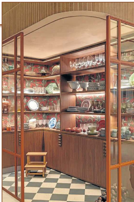
Os materiais adequados trazem conforto e luxo

e pedra, trazem aconchego e sensação de durabilidade. Cores neutras acalmam o olhar e facilitam a leitura do espaço, enquanto acabamentos suaves evitam excesso de informação visual. Para Emile, marcenaria planejada, MDF de qualidade, vidro, espelhos e metais discretos ajudam a compor ambientes equilibrados, resistentes e atemporais.