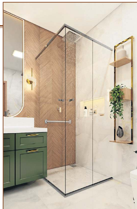
A técnica walk-in torna ambientes mais espaços e permite um respiro

*Estagiária sob supervisão de Sibeles Negromonte