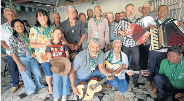
Festa aos magos — Com 40 anos de tradição, a Folia de Reis em Planaltina é uma das mais importantes do país. Celebração na Rua Piauí reúne devotos de toda a cidade. PÁGINA 17