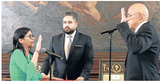
No poder — A vice Delcy Rodríguez assume como presidente interina da Venezuela. Filho de Maduro, Nicolasito (C), acompanha a posse e promete apoio.