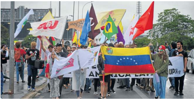
Mira em Trump — Cerca de 250 pessoas participaram ontem, na Esplanada, de um protesto contra a intervenção militar dos EUA. Houve provocações aos manifestantes.