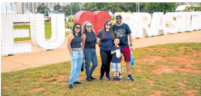
Mariana Campos/CB/D.A. Press