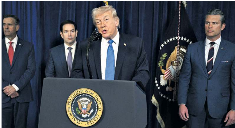
Donald Trump destacou que petroleiras do EUA vão atuar no país

Confira detalhes da ação que levou Maduro para Nova York