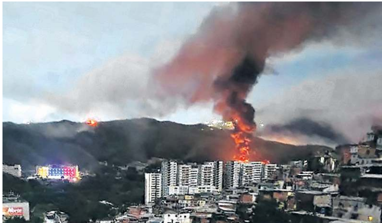
Intensos e estratégicos bombardeios atingiram Caracas na madrugada