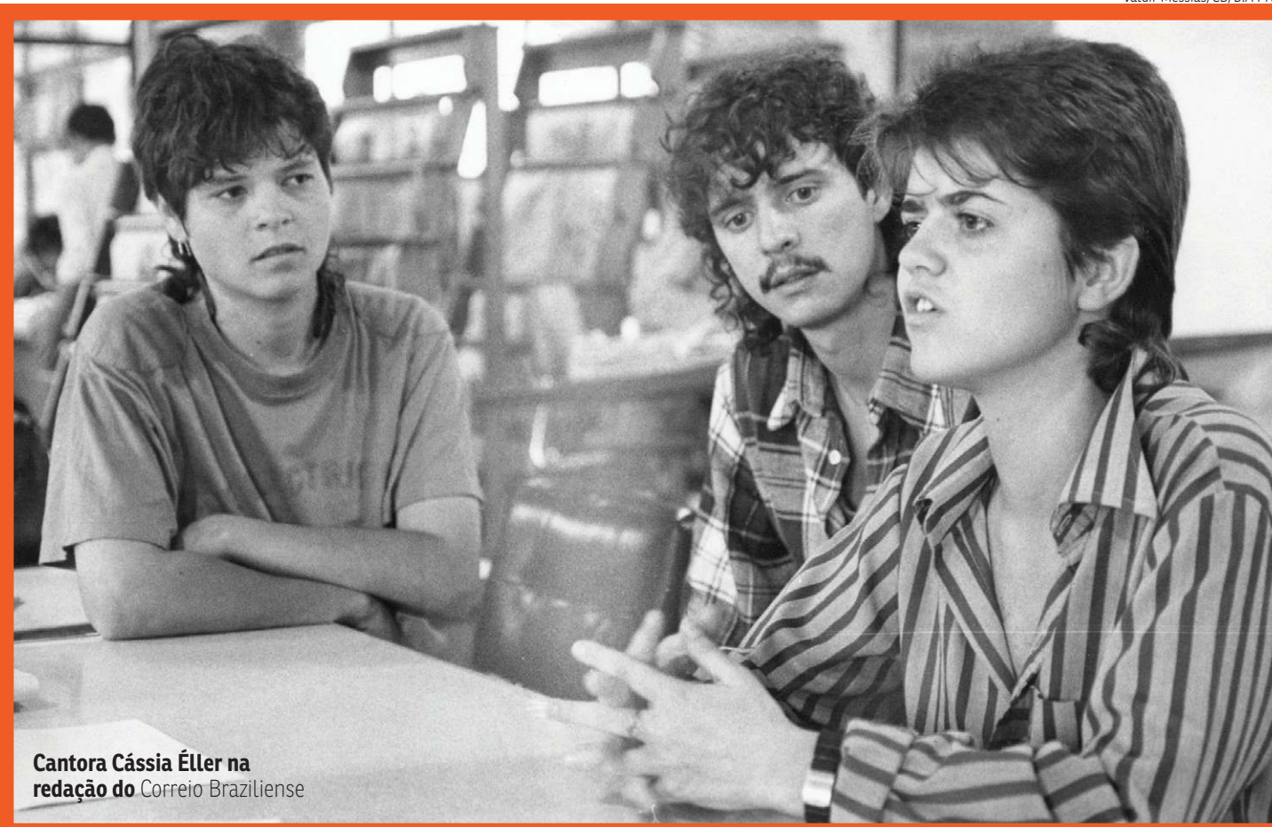
Cantora Cássia Eller na redação do Correio Braziliense