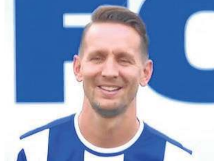
» Luuk de Jong Posição: volante Clube: Porto

O atacante holandês de 35 anos vive um drama pessoal. Está fora da temporada do time português depois de sofrer uma lesão no ligamento cruzado anterior do joelho esquerdo. Fora da temporada depois de desembarcar no Estádio das Antas como principal contratação do Porto, ele tenta acelerar a recuperação para disputar uma vaga na lista final do técnico Ronald Koeman. Monitorá-lo é relevante por um motivo simples: a Holanda é uma das possíveis adversárias do Brasil na segunda fase da Copa do Mundo de 2026.