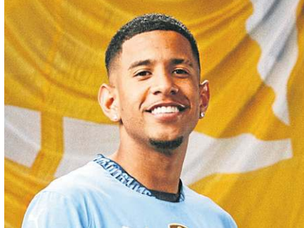
» Savinho Posição: atacante Clube: Manchester City

O capixaba de 21 anos tem dois gols em 22 jogos nesta temporada sob o comando de Pep Guardiola. Pouco para reivindicar presença na Copa do Mundo de 2026. A disputa para ir ao torneio na América do Norte é acirrada. Embora ele tenha facilidade para atuar nas duas extremidades do campo e, até mesmo, na função de meia, a disputa é acirrada na esquerda com Vinicius Junior e Gabriel Martinelli; e na direita com Estêvão, Raphinha, Luiz Henrique, Antony e David Neres. Sem contar os não menos versáteis Rodrygo e Neymar.