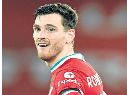
» Andrew Robertson Posição: lateral-esquerdo Clube: Liverpool

O baita jogador dos Reds finalmente vai realizar o sonho de disputar uma Copa do Mundo. Faltava esse "título" no currículo depois de colecionar nove troféus com a camisa do Liverpool, entre eles a Liga dos Campeões em 2018/2019 e um bicampeonato da Premier League nas temporadas de 2019/2020 e de 2024/2025. A Escócia está classificada para o evento na América do Norte e Robertson tem tudo para enfrentar o Brasil na terceira rodada do Grupo C em 24 de junho, às 19h (de Brasília), na partida marcada para Miami.