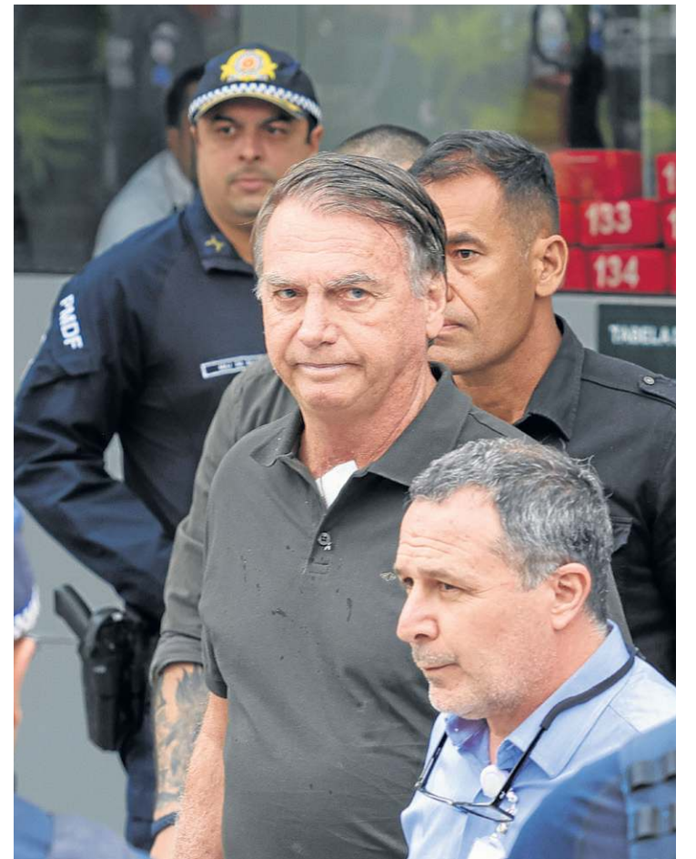
Mesmo preso e inelegível, votos da direita ainda dependem do ex-presidente

para serem feitas nos últimos anos, para que isso seja percebido pela população como aquilo que o governo conseguiu oferecer nos seus quatro anos”, explicou.