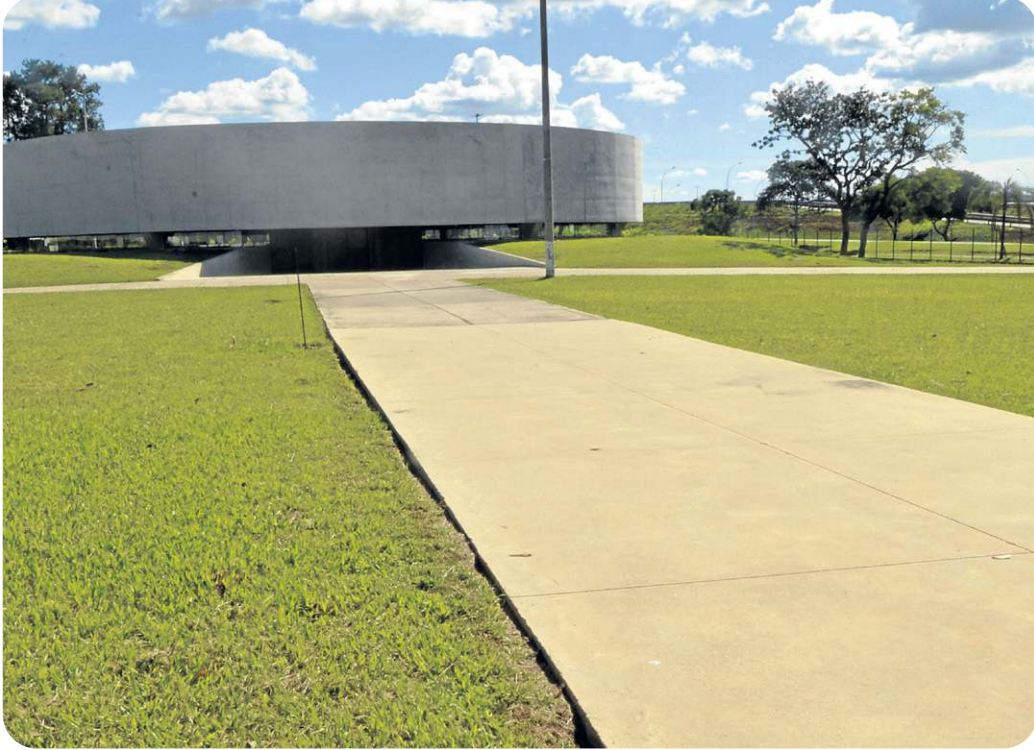
Carlos Vieira/CB Press